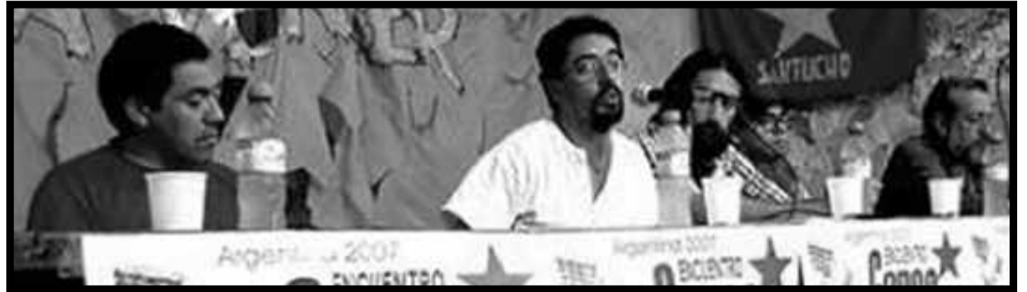
Reunión del "Encuentro del Cono Sur".

de trabajo del FSP, estos estranguladores de la revolución recién iniciaban su trabajo en Chile, porque en verdad éstos se reunieron para fortalecer esta instancia y sus labores en Chile y El Salvador. Es que estas direcciones reformistas saben que, si bien su accionar logró expropiar la revolución boliviana, en Latinoamérica hoy destacan en el combate de clases las importantes luchas de la clase obrera y los explotados de Chile, Perú y México, entre otros. Saben que, bajo las condiciones de la nueva crisis de la economía mundial imperialista que ha comenzado, pueden irrumpir nuevas respuestas de masas, con revueltas, huelgas y enfrentamientos espontáneos que tiendan a generalizarse, yendo así en auxilio de las masas bolivianas y transformándose en un nuevo obstáculo para el proceso de restauración capitalista en Cuba.