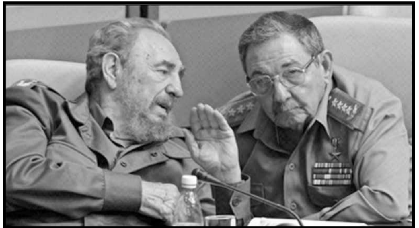
Fidel Castro junto a su hermano Raúl

Como planteamos en las tesis en estas mismas páginas, China, Rusia y demás ex estados obreros en los que el capitalismo había sido restaurado a partir de 1989, jugaron el papel de una verdadera transfusión de sangre fresca para que el anciano moribundo que es el sistema capitalista imperialista mundial pudiera remontar la crisis de 1997-2001.