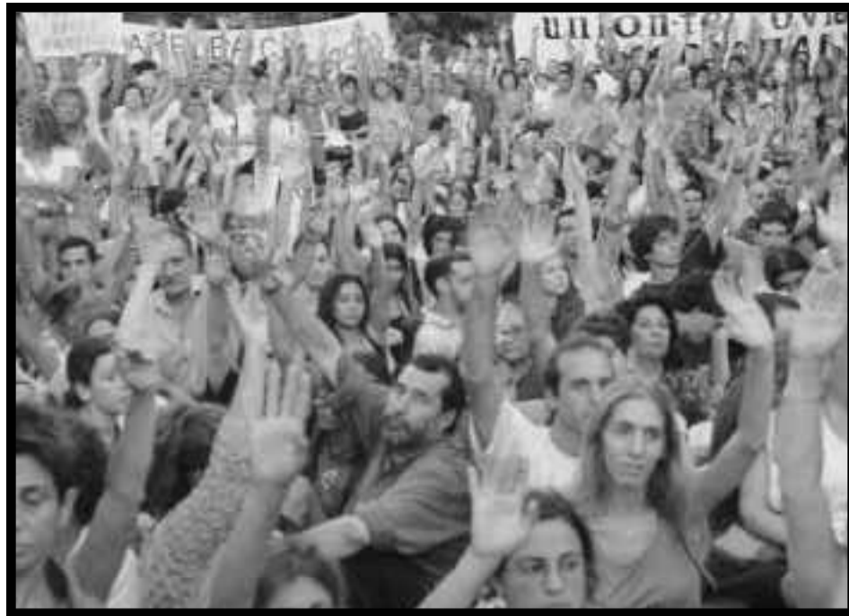
Asamblea Popular de Parque Centenario en 2002

Las corrientes reformistas no podían denunciar esto, porque fueron ellas las que llamaron a votar a Lula en Brasil,