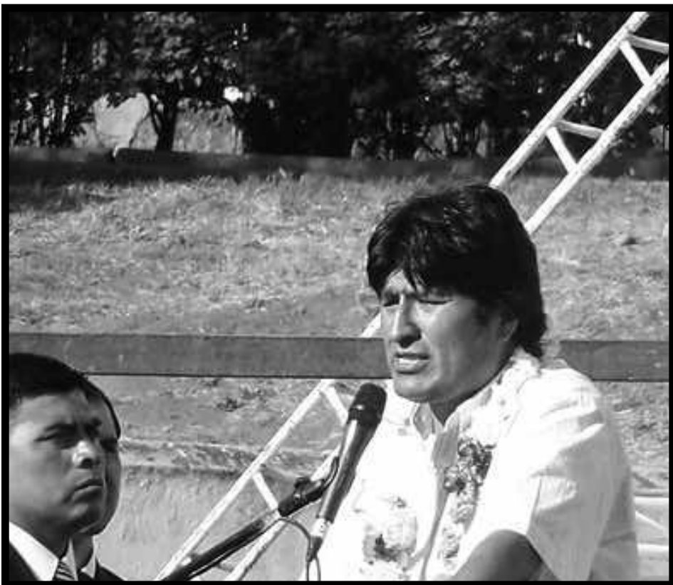
Evo Morales en la “Cumbre de los Pueblos”.

SECRETARIADO DE COORDINACIÓN Y ACCIÓN INTERNACIONAL DE LA FLT