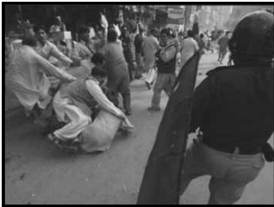
Pakistán: policías reprimen manifestación contra el régimen de Musharraf

Presentamos entonces, en este número de fin de año de “El Organizador Obrero Internacional”, un Dossier Especial de debate y reflexión, hacia el 3º Congreso de la FLT, sobre el estallido de la crisis de la economía mundial ca-