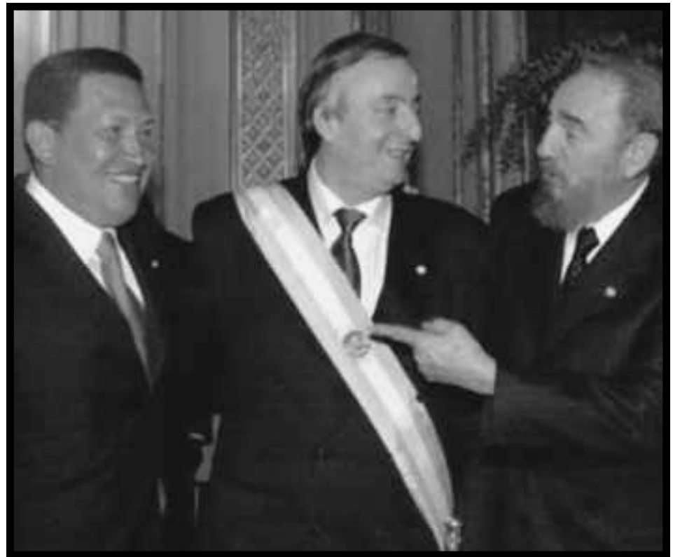
Chávez y Fidel Castro junto a Kirchner en su asunción presidencial

Tras estos emotivos reconocimientos a los servicios contrarrevolucionarios prestados por la cúpula mayor del Foro Social Mundial para salvar los intereses del imperialismo y de la burguesía nativa en Argentina, los aplausos iban desde la corona española hasta la delegación de la burocracia cubana. Es que la burguesía sabe que un gobierno como el de Kirchner, que había asumido totalmente debilitado, con tan sólo el 21% de votos, sin ninguna institución sólida para contener a las masas, golpeado por mil y un combates de la clase obrera y los explotados, logra hoy llegar a término y encaminarse a continuar su obra ahora en manos de Cristina ¡Esos aplausos de la burguesía imperialista y de sus siervos nativos eran el festejo de que estrangulaban una revolución y que los explotados están más sometidos que antes, y que, gracias a ello, hoy los monopolios para sostener sus ganancias disponen de millones de trabajadores hambreados y esclavizados controlados por una banda de pistoleros de los sindicatos de la CGT y la CTA! ¡Era el festejo porque finalmente este régimen -ahora legitimado por los millones de votos- puede dar los pasos decisivos para garantizar la “seguridad” a los saqueadores de la nación!