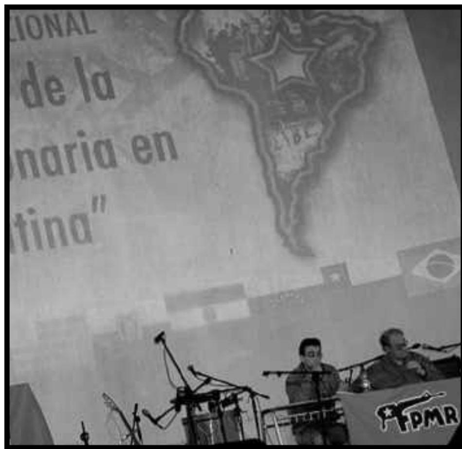
Encuentro Internacional del FPMR y otras corrientes castristas-populistas de América Latina en 2006 en Chile

Así, en el Proyecto Político del FPMR, que es el material que ampara toda su política práctica, haciendo a un lado todo lo que podríamos llamar "periodismo transgresor" y que abunda en dicho material, podemos encontrar definiciones claves que grafican cual es el sustento teórico de los rodriguistas. Éstos afirman que en el actual periodo la principal contradicción que encontramos en nuestra sociedad, es la existente entre nación e imperialismo: "La contradicción principal del periodo es justamente entre 'neo liberalismo' v/s lo nacional, manifiesto en que en las actuales condiciones históricas y políticas, lo 'nacional' se ha transformado casi en un elemento subversivo, ya que basta plantear