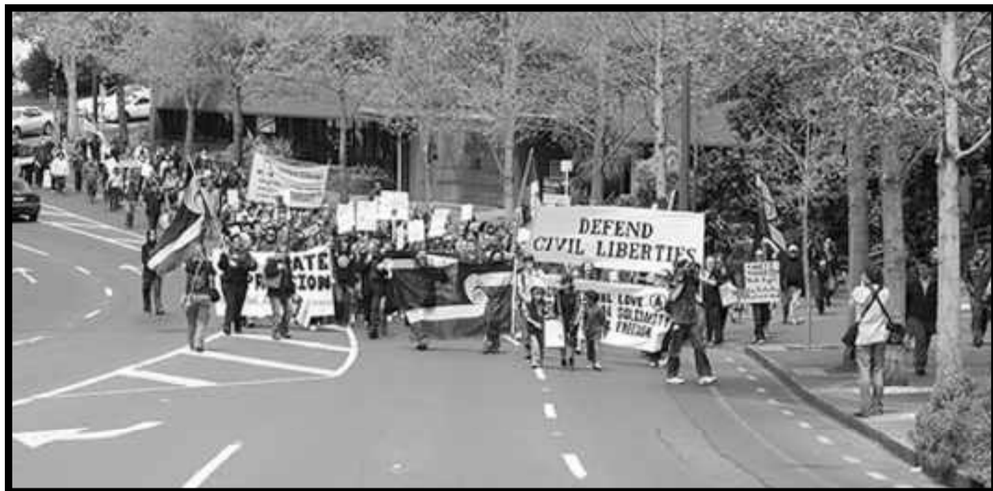
Movilización en Auckland, capital de Nueva Zelanda, exigiendo la libertad de los presos políticos

La policía dice que ellos han actuado por propia decisión y autoridad en el interés de la "seguridad pública" y que los acusados han estado todos envueltos en "campos de entrenamiento de tipo militar" en los Ureweras (zona montañosa inhóspita de la isla Norte de Nueva Zelanda, de donde son originarios los Tuhoe, NT). El gobierno y sus partidarios están pretendiendo que la policía va a tener una buena razón para usar la Ley antiterrorista, por sobre toda otra legislación ya establecida, y que le corresponde a la policía actuar de acuerdo a la evidencia. El Laborista Chris Trotter alimenta esta histeria alarmista especulando sobre planes de "lucha armada". Un muy conocido responsable de un blog de la Izquierda Laborista, el "Tira-bombas" Bradbury, pretende tener información interna de la policía de que la misma tiene elementos de sobra para respaldar los cargos. Sin embargo, el ministro de Asuntos Maoríes, Parekura Horomeia,