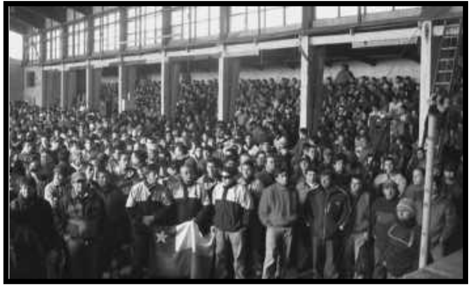
Los obreros forestales, impusieron con su lucha un comité de huelga para pelear por sus justas demandas.

Dos barricadas se levantan en el combate de clase en Chile: la de la clase obrera y los explotados que en sus luchas han desafiado el poder patronal en los principales centros productivos del país, en las fábricas, el orden burgués de sus leyes y sus fuerzas de choque en las calles y que de esa manera han sostenido una pelea por desatar un solo combate contra el régimen burgués, y la de los reformistas como los "pacos rojos" del PC y la CUT y de todas aquellas direcciones que por más "clasistas" que se pinten, llaman a luchar por reformar al régimen y sus leyes, al estado y las FF.AA. y así se encargaron de cerrar el