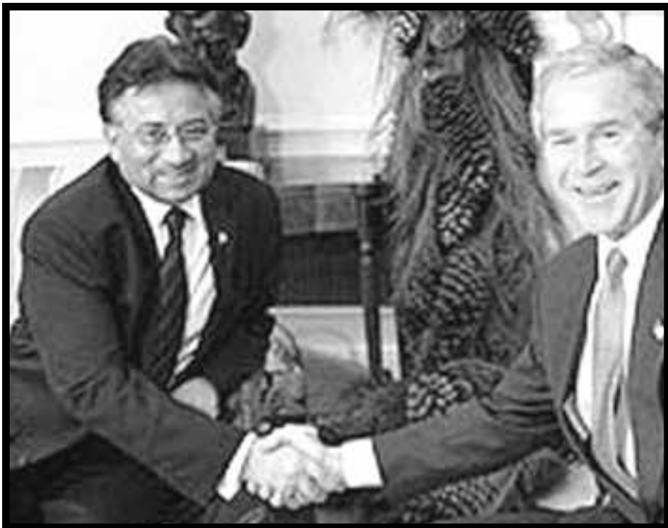
El dictador Musharraf junto a su amo imperialista, el genocida Bush