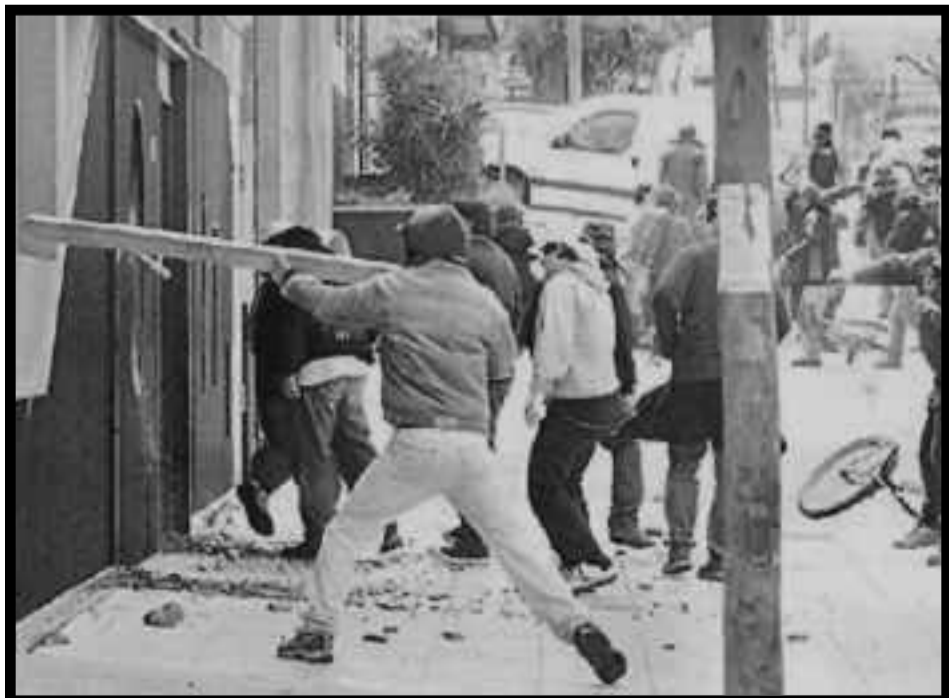
Obreros del pescado en Mar del Plata en huelga atacan una empresa procesadora

En los últimos años, las mismas fuerzas contrarrevolucionarias continentales que estrangulaban la revolución argentina, fueron las que cercaron la revolución boliviana. Así, vemos hoy en Bolivia al gobierno “antiimperialista” de Morales -