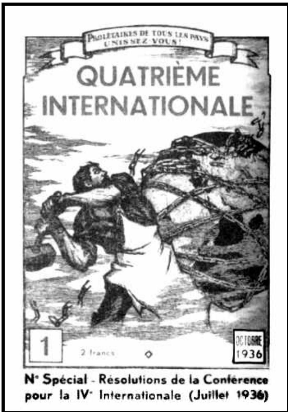
Portada de Quatrième Internationale, anunciando las resoluciones de la Conferencia por la IV Internacional en 1936