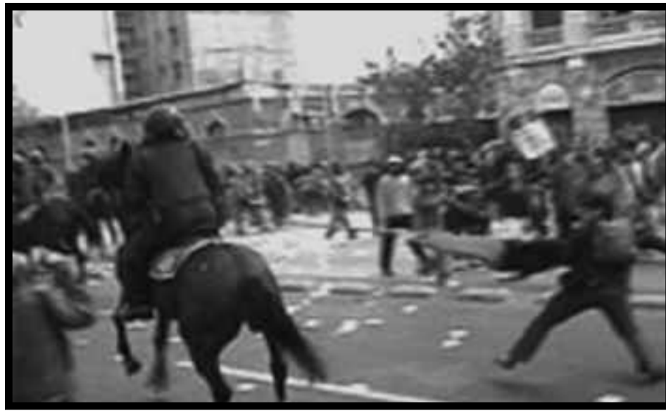
El Primero de Mayo : enfrentamiento contra los pacos en Santiago.

Es innegable que de parte de las masas combatividad y entrega no ha faltado en el transcurso de la lucha directa que iniciaron por terminar con la miseria, explotación y represión que les impone el régimen colonial del TLC, cuando el saqueo voraz del cobre que desde hace años presenta precios históricos ha provocando un aumento en las ganancias de las transnacionales nunca antes visto, al igual que los demás recursos naturales; cuando la súper explotación de la clase obrera ha hecho obtener jugosas ganancias a la patronal nacional y transnacional; y cuando todo lo que signifique suculentos negocios para las transnacionales imperialistas, como el transporte, la educación y salud, los servicios básicos, etc., les ha sido entregado por la Concertación, como los mejores continuadores de Pinochet que son. Asimismo, es indiscutible que sobre esta contienda, desde la cúpula de la CUT, logró montarse el PC y el PS, así como también, desde distinta ubicación, como las Coordinadoras que pusieron en pie y los sindicatos y agrupaciones que encabezan, por el FPMR y las organizaciones que se re-