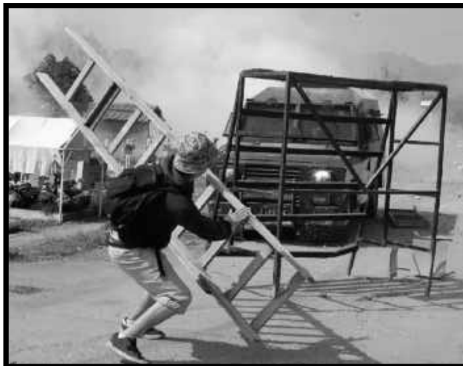
Represión en Chile el pasado 11 de septiembre

Ahora entendemos porqué el FPMR llama a reformar la Constitución del '80, como con las 3 o 4 reformas que propone al código laboral, como la reforma que promueve para las FF.AA., o por qué llama a desarrollar un proceso de industrialización que favorezca a las Pymes, pues lo confiesan cuando dicen que