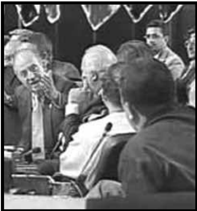
El Borbón manda callar a su socio menor Chávez

Porque "Que te vayas" ya lo dijo la clase obrera argentina en 2001 al grito de "Que se vayan todos, que no quede ni uno solo"; ya lo dijo la revolución boliviana contra la Repsol, la British y demás petroleras imperialistas al grito de "¡Fuera las transnacionales, el gas para los bolivianos!"; ya lo dijo la revolución ecuatoriana al grito de "Y no queremos, y no nos da la gana, de ser una colonia norteamericana". ¡Allí, en el proletariado, está el verdadero caudillo de las naciones oprimidas de América Latina! Sólo el proletariado victorioso redimirá a los pueblos oprimidos por el imperialismo yanqui, por la Corona española y demás carniceros de las potencias imperialistas. •