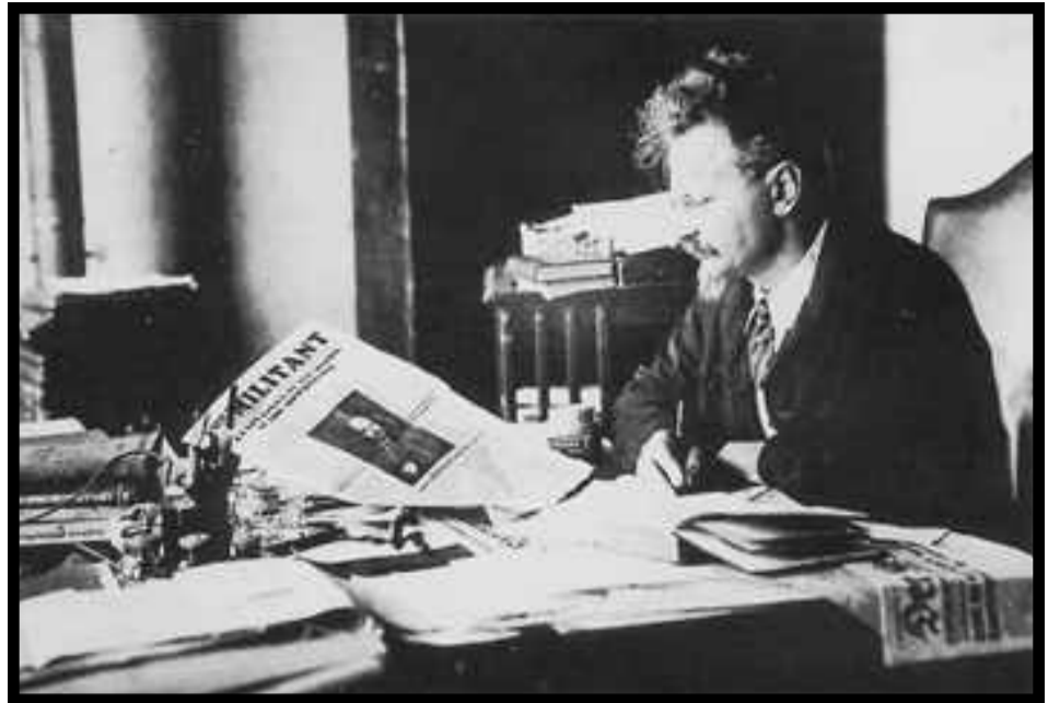
León Trotsky, fundador de la IV Internacional

cho de defenderse de la explotación de los nuevos patrones en las empresas mixtas y privadas, y de los abusos de la burocracia restauracionista en las empresas estatales: ¡hay que imponer la libertad de organizar sindicatos!