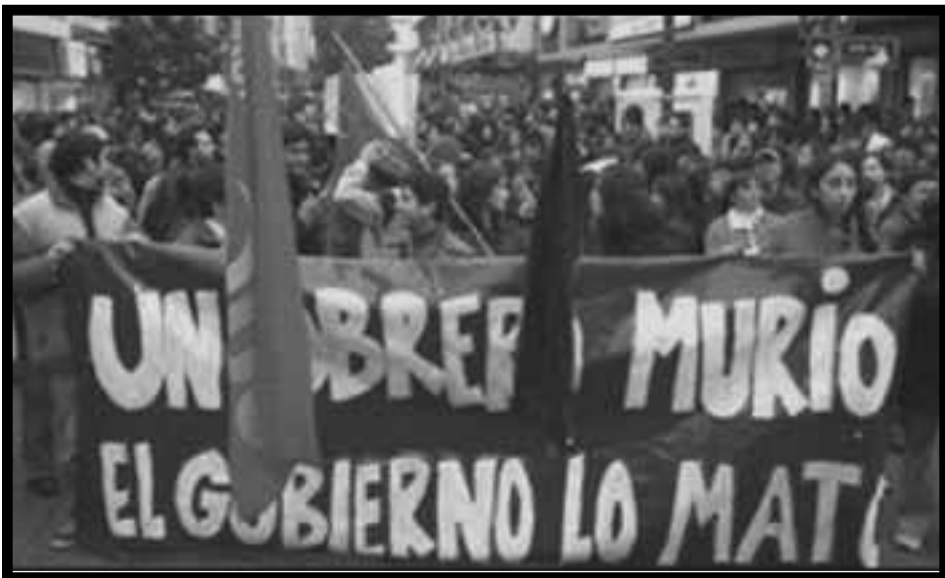
Manifestación en repudio al asesinato del obrero forestal Rodrigo Cisterna.

La primera tarea es reabrir el camino a la huelga general insurreccional, para conseguir el objetivo de lucha que es capaz de unificar a todos los explotados del país en