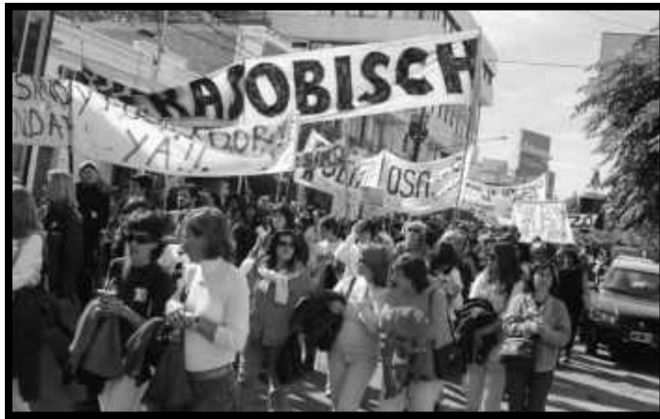
Neuquén: Docentes y trabajadores se movilizan al grito de ¡Fuera Sobisch, asesino!

O sea, les hicieron creer a los obreros que la conquista de las fábricas recuperadas era gracias a los políticos patronales; le dijeron a la clase obrera que los jueces kirchneristas combatían contra el genocidio; le dijeron a los trabajadores sublevados de la Patagonia –mientras Kirchner, al estilo de Videla, militarizaba Santa Cruz– que todo se resolvía con el ARI y la UCR. Les hicieron creer a los trabajadores de Neuquén que con los kirchneristas que sostenían a Sobisch, se enfrentaba al asesinato de Fuentealba. Y como perla de semejante oprobio, hicieron circular un peticionario para que los diputados de los partidos patronales lo firmen exigiéndole a Kirchner que castigue a los asesinos de