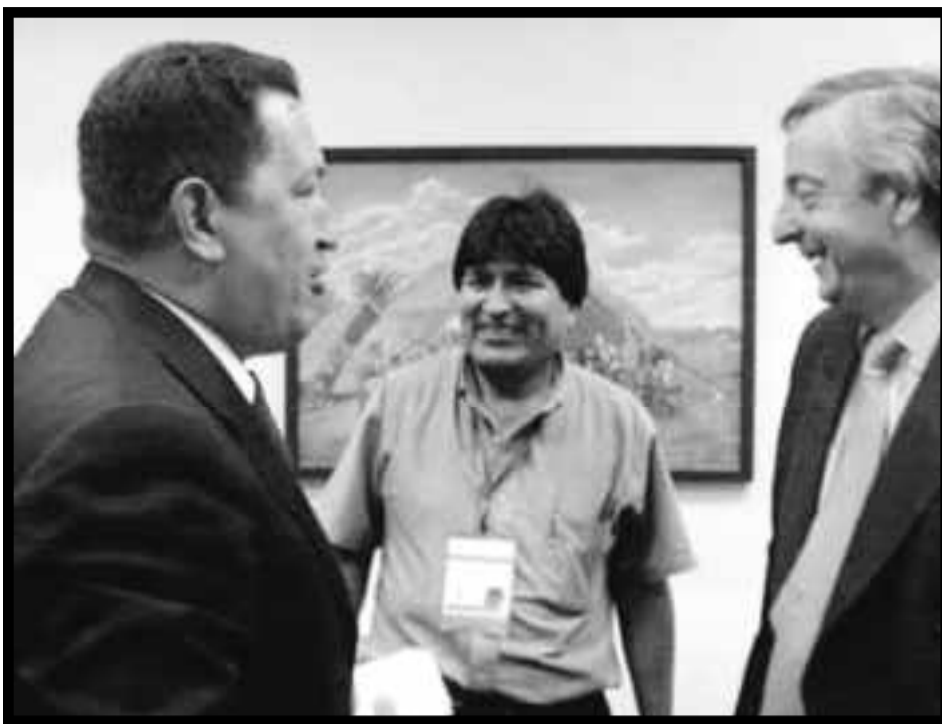
Kirchner junto a Chávez y Evo Morales

Fidel Castro en persona vino a Argentina dos veces para asegurarse del estrangulamiento de la revolución de diciembre de 2001, como lo hiciera en Chile en 1973 con la gloriosa revolución de los cordones industriales, plan-