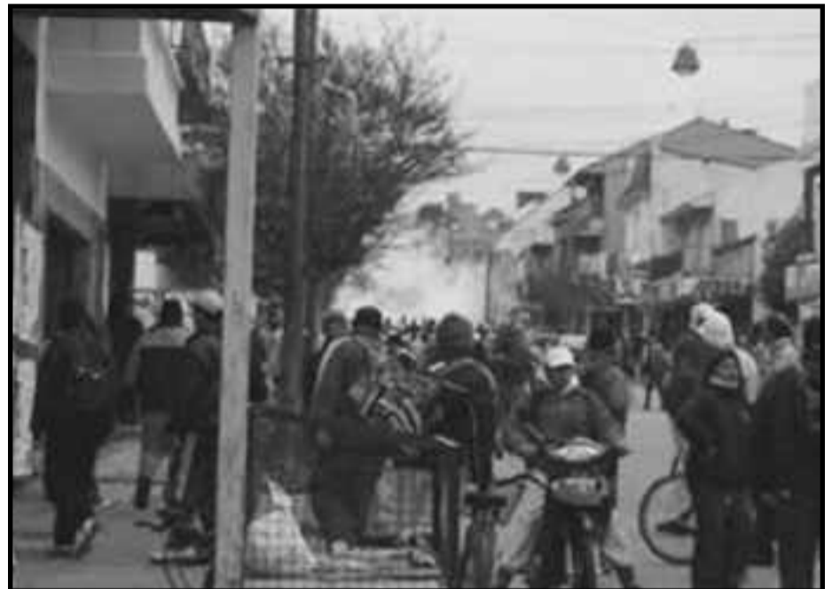
Piquete de obreros del pescado recorren las calles de Mar del Plata

También llamamos urgentemente a todos los trabajadores del país, a todas las organizaciones obreras de lucha —de ocupados y desocupados— y a todos los estudiantes combativos, para poner en pie de inmediato un Comité de Lucha Nacional para unificar a los trabajadores y estudiantes. Necesitamos que envíen delegados y representantes de sus asambleas de fábricas, establecimientos, oficinas, escuelas, barrios y universidades para que se hagan presentes en el SOIP. Acá discutiremos entre todos como nos