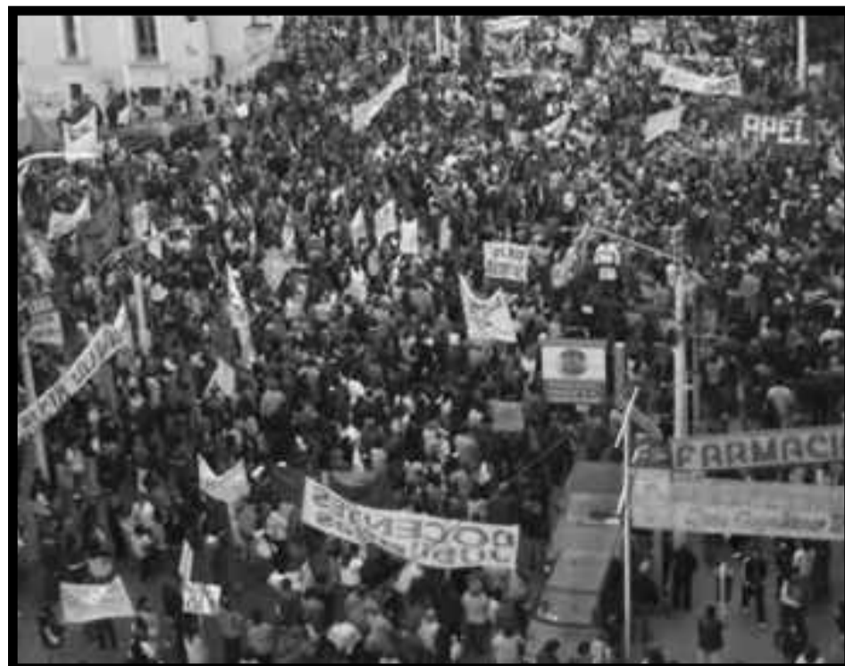
Movilización docente en Santa Cruz

Es que esta vez, la burguesía apeló no a un golpe semi-fascista como en 1976, sino que antes de llegar a ello, apeló a la pérvida política continental de frente popular y colaboración de clases