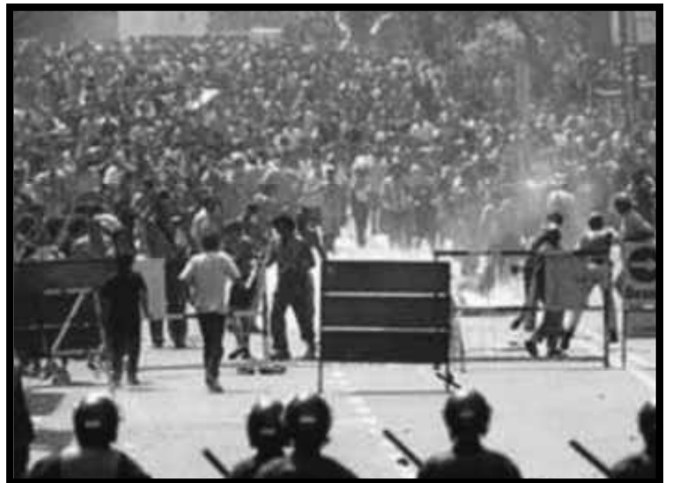
Las masas en acción el 20 de Diciembre de 2001