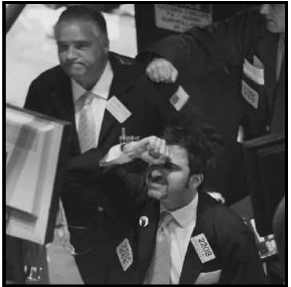
Parásitos de Wall Street frente al derrumbe de las bolsas

..... L a crisis está acá, pero también ha comenzado la respuesta de masas. La situación mundial comienza a tensarse. En la misma, se cocinan a fuego lento,