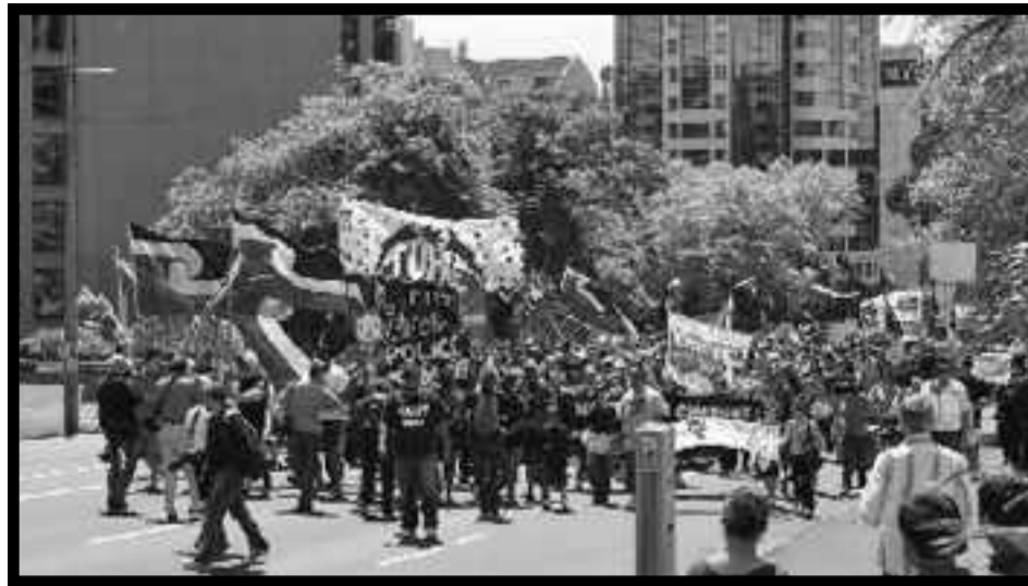
Marcha por la libertad de los presos políticos

La izquierda "socialista" tiene razón en gran medida. Nueva Zelanda es un país débil y dependiente en una economía glo-