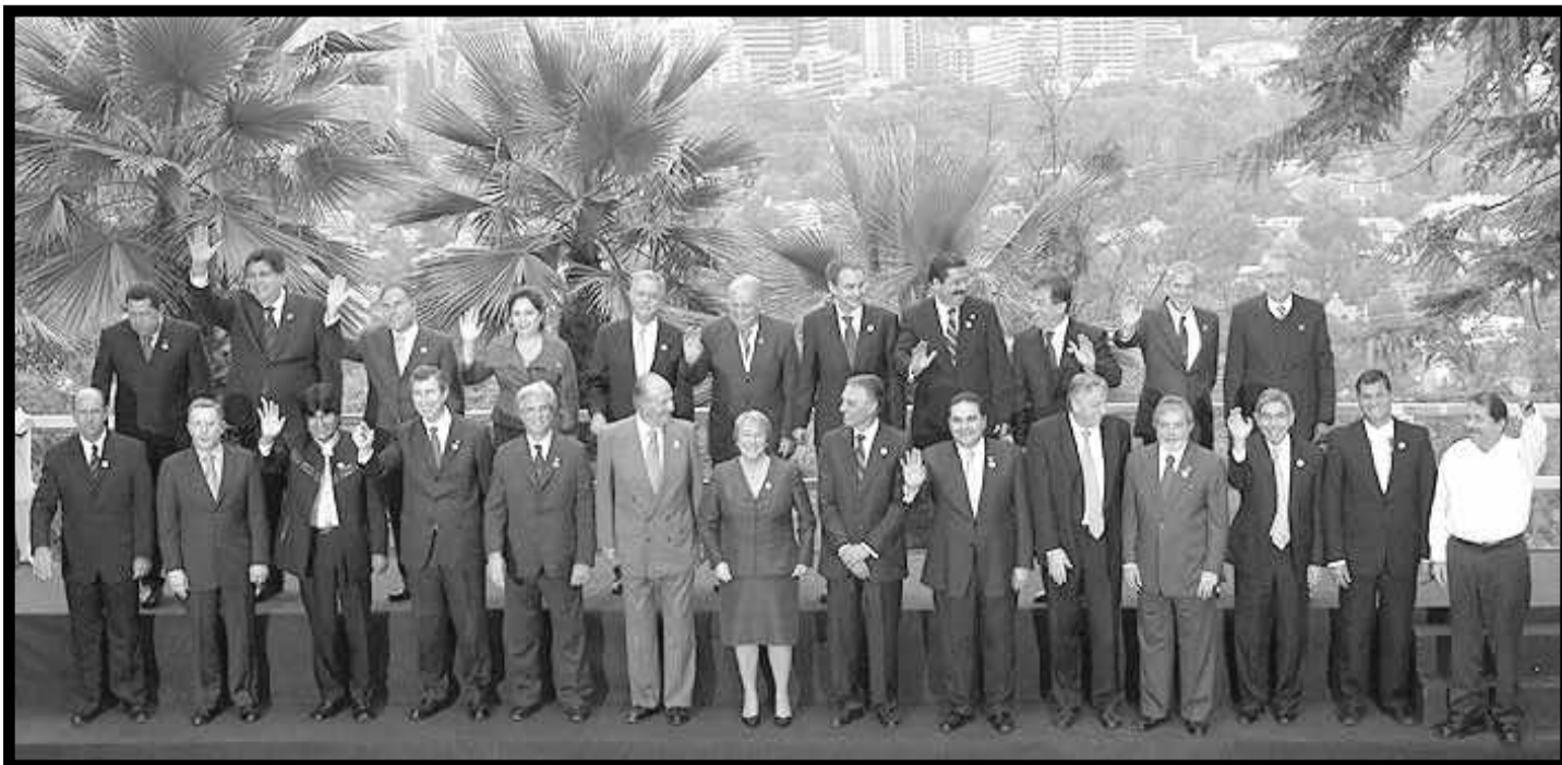
El Borbón junto a la anfitriona Bachelet y los presidentes latinoamericanos en la Cumbre Iberoamericana realizada en Chile

Por ejemplo, la burguesía brasileña y Lula, aunque no han firmado un TLC con los Estados Unidos, son sin dudas los más abiertos agentes del imperialismo yanqui, con el que se están asociando ahora para la producción de biocombustibles. Y al mismo tiempo, están asociados al imperialismo francés y a la Totalfina -de la que Petrobras es testaferrero en el negocio del petróleo y el gas. La burguesía chilena, con su TLC, ha trans-