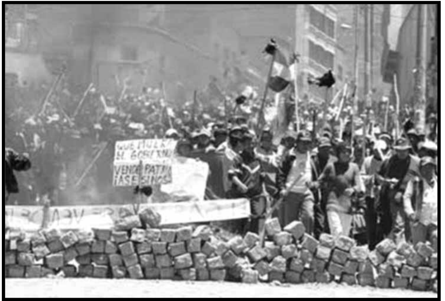
Bolivia: barricadas en La Paz en Octubre de 2003

Todo obrero que lucha por el socialismo debe abrazar el trotskismo. El que quiera defender las conquistas de la revolución cubana debe estar por la revolución política, por que se acaben la burocracia con sus medallas y condecoraciones y la desigualdad salarial, y por un gobierno sin burócratas millonarios, basado en los consejos de obreros, campesinos y soldados. Ese es el único camino para que Cuba sea un baluarte de la revolución latinoamericana y mundial, y no de la contrarrevolución y del estrangulamiento de la revolución latinoamericana como hoy le imponen ser los traidores de la burocracia castrista, como lo hicieron en décadas pasadas