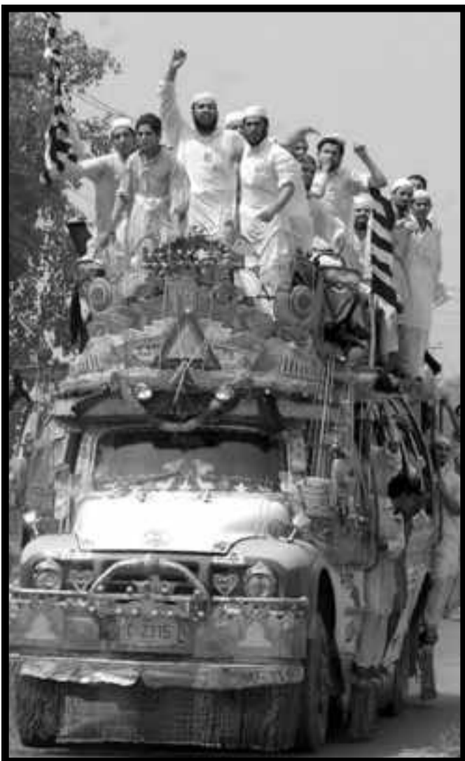
Trabajadores paquistaníes en camino a una manifestación contra el estado de sitio decretado por la dictadura