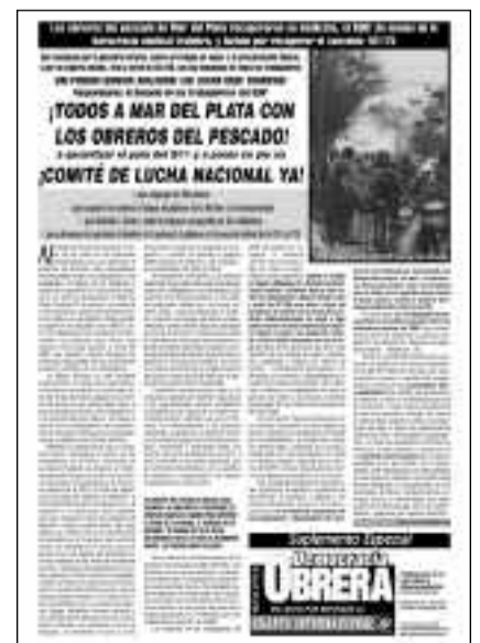
Portada del Suplemento Especial de Democracia Obrera donde se reproduce el llamamiento de los obreros del pescado de Mar del Plata

Votado en la asamblea del SOIP del 30/10/07