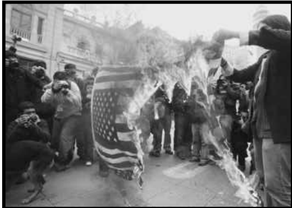
Chile: queman la bandera yanqui durante una movilización

El trotskismo argentino será refundado sólo cuando sea parte y combata por poner en pie un partido revolucionario latinoamericano que coordine la rebelión contra los “pacos rojos” de la clase obrera chilena, que la organice y la extienda decididamente a la lucha contra todas las burocracias y aristocracias obreras del continente, que unifique y centralice a la clase obrera boliviana para recuperar su revolución de obreros y campesinos, para sublevar a las clases