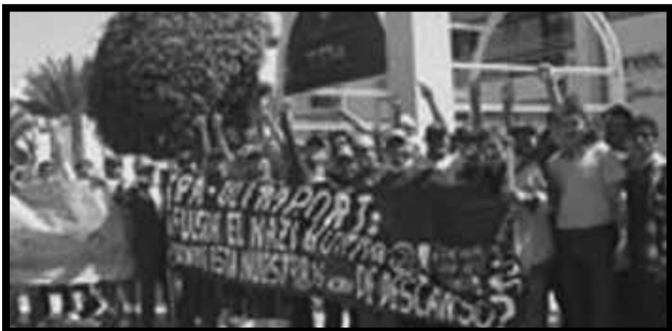
Piquete de obreros portuarios de Arica.

Por eso, la negociación de la Concertación y la Derecha (UDI y RN) por la nueva reforma educacional y finalmente el acuerdo que establecieron que la transforma en proyecto de Ley, no tuvo ningún cuestionamiento de los estudiantes, a pesar de que es una nueva trampa, una gran trampa que cambiará cosméticamente,