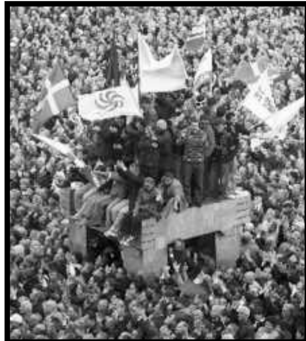
Manifestación en Tiflis, la capital georgiana