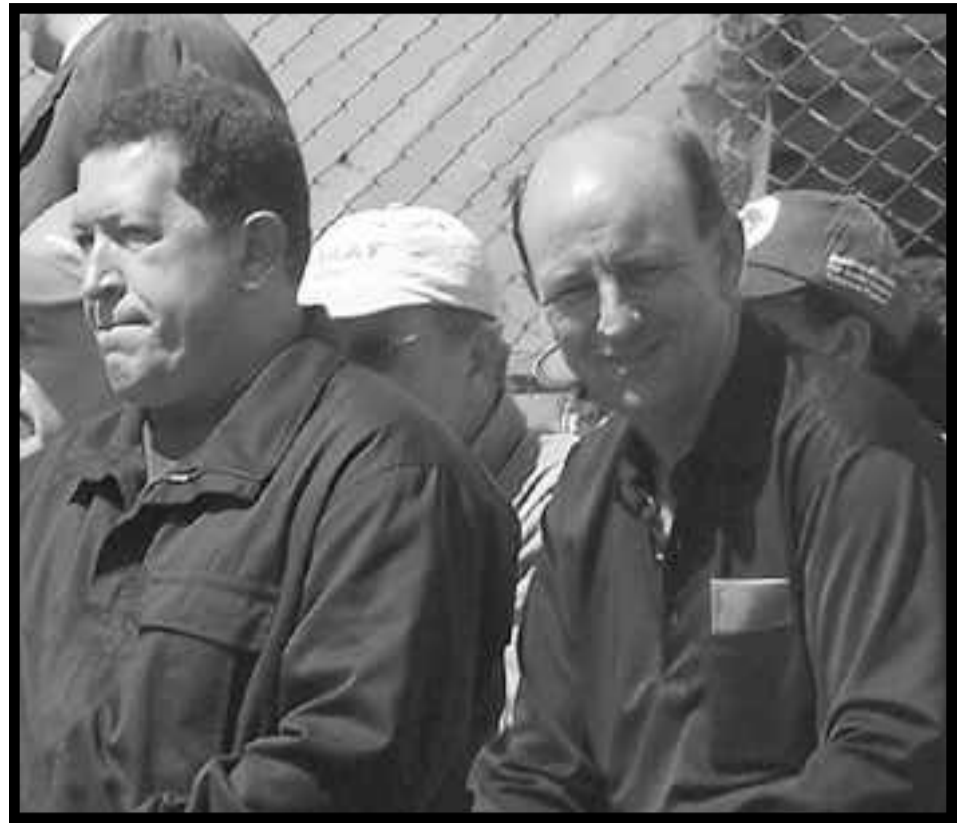
Chávez junto al vicepresidente de Cuba, Carlos Lage, representante de la burocracia castrista restauracionista en la “Cumbre de los Pueblos” en Chile

Queda por demás claro que la liberación de nuestras naciones del yugo imperialista y la unidad e integración de la clase obrera y los explotados de América Latina jamás vendrá de la mano de estas