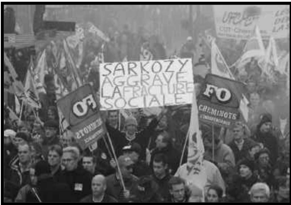
Francia: Trabajadores ferroviarios en huelga