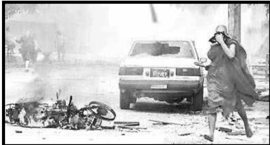
Feroz represión de la dictadura birmana contra las masas

El inicio de la crisis significó en Birmania que la dictadura duplicó en un solo día el precio de los combustibles y de los alimentos. Fue la gota que colmó el vaso de los trabajadores y los explotados, que irrumpieron espontáneamente en una enorme revuelta por el pan y por la libertad que es la continuidad en Birmania de las decenas de miles de revueltas obreras y campesinas por el pan, la tierra, contra la esclavitud que sacuden cada año a China. La irrupción de las masas enfrentando la violenta represión que dejó al menos 200 muertos,